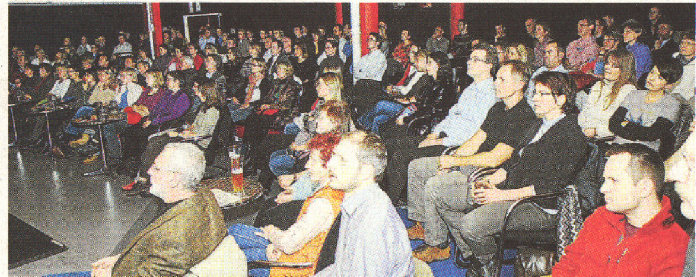
Reges Interesse: Etwa 150 Bürger informierten sich am Mittwoch im Fools über die Aussichten, in Holzkirchen ein Gymnasium zu bekommen.